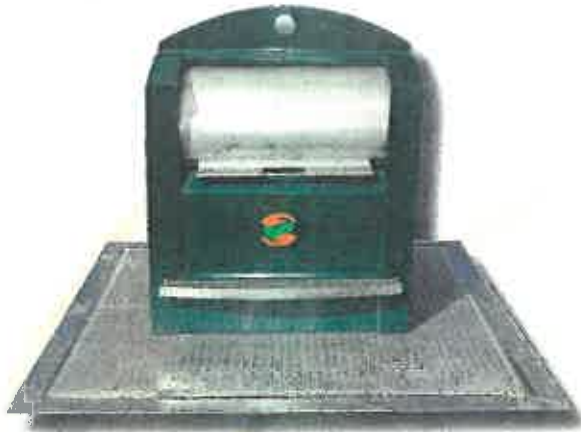
פילר מתכת (3-5 קוב)