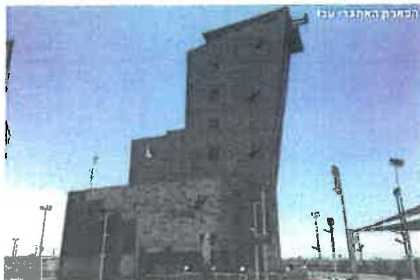
הסכנת האתגר עכו