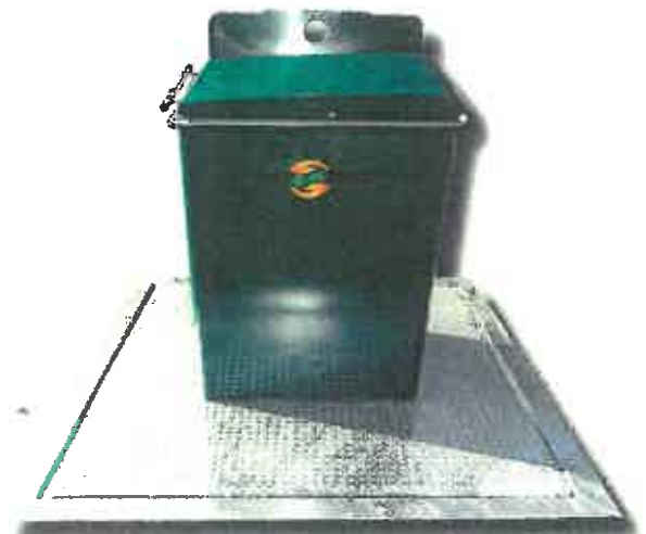
פילר מתכת (3-5 קוב)