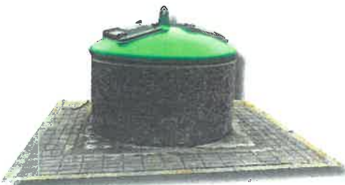
טמון עגול ממתכת ללא צורך בהחלפת שקיות (4 קוב)