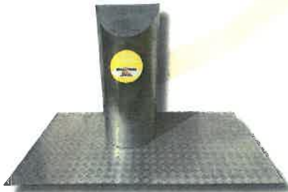
פילר נירוסטה למיחזור בקבוקים (3-5 קוב)