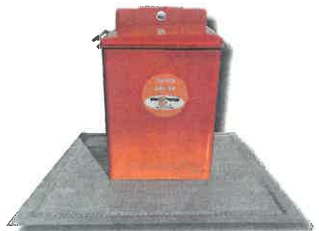
פילר למיחזור אריזות (3-5 קוב)